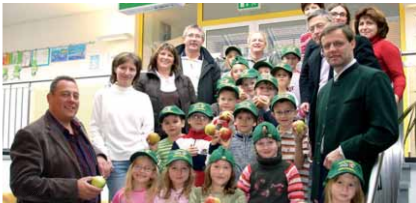
Kinder der VS Gerolding mit Lehrkräften und Vertretern der Gemeinde

Bau- und Sanierungstätigkeiten in den Hauptschulen Loosdorf und Karlstetten, treffen auch unsere Gemeinde mit zusätzlichen Kosten. In der Volksschule in Gansbach konnten die notwendigen Renovierungsarbeiten im Innenbereich abgeschlossen werden. Die Dach und Außensanierung wird im Haushaltsplan für die nächsten Jahre berücksichtigt.