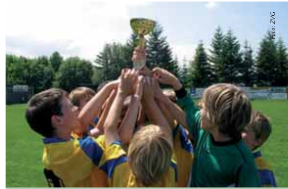
Sportlicher Höhepunkt: Die Spieler der VS Gerolding erreichten beim Mike-Cup den 2. Platz.