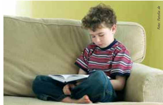
Wir wollen Zeit zum träumen und denken: Bücher helfen dabei

kommen. Mit dem Ankauf von Comics und einiger Bücher aus der Reihe ‚Freche Mädchen- freche Bücher‘ hoffen wir, auch jugendliche Leser wieder verstärkt für die Bücherei zu interessieren. Wir denken, dass auch in Zeiten, wo Fernseher, Computer, Handy und andere elektronische Medien bevorzugte Freizeitbeschäftigungen unserer Jugendlichen sind, Bücher nichts von ihrem Wert verloren haben. Vielleicht muss man nur das richtige Buch finden, um auch das Interesse am Lesen wiederzubeleben. Um uns das Aussuchen neuer Bücher zu erleichtern, haben wir einen Fragebogen erstellt, den wir an die erwachsenen Leser ausgeben, um ihr Leseverhalten und ihre bevorzugte Literatur zu erfragen. Damit können wir unser Angebot noch aktueller und leserorientierter gestalten. Wir würden uns freuen, wenn wir Sie/ Dich im