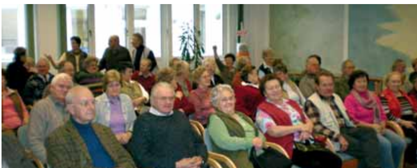
Interessierte Zuhörer bei der Werksbesichtigung der Firma Ardex

Wir hoffen auch im neuen Jahr auf zahlreiche Teilnahme an unseren Veranstaltungen, und wünschen allen SeniorInnen ein glückliches und gesundes Jahr 2008, der Ausschuss der Seniorenrunde. ■