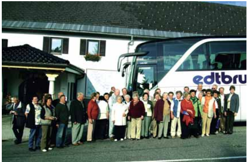
Gute Stimmung und vor allem strahlender Sonnenschein machten den zweitägigen Ausflug ins Mühlviertel zu einem schönen Erlebnis.

Unsere Fahrt ins Mühlviertel hat uns viele neue Eindrücke dieser zauberhaften Landschaft gebracht. Interessante Besichtigungen wie z. B. Kürbisbierbrauerei, Schnaps-