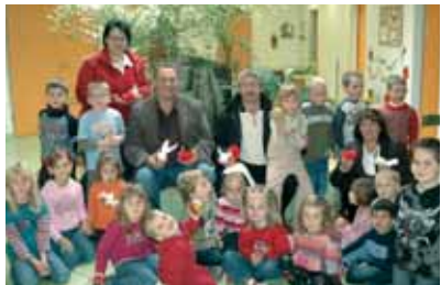
Kinder im Kindergarten Mauer am Tag des Apfels