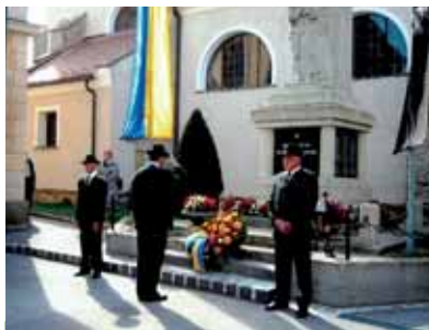
Feierliche Kranzniederlegung zu Allerheiligen

zug des Vereinskastens in das Areal des ehemaligen Lagerhauses wo wir ausmalten und den Vereinskasten übersiedelten.