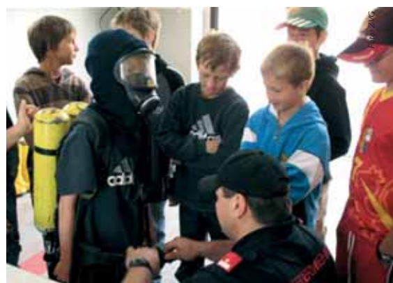
Einmal Feuerwehrmann sein ...

Unser 125-jähriges Jubiläum wurde bei unserem Feuerwehrfest von 06. bis 08. Juli gefeiert. Am Freitag fand ein Seilziehbewerb statt, wo 10 Gruppen um den Sieg kämpften. Samstags spielten die Mostlandstürmer zum Tanz auf. Am Sonntag wurde mit einer Feldmesse und anschließenden Festakt