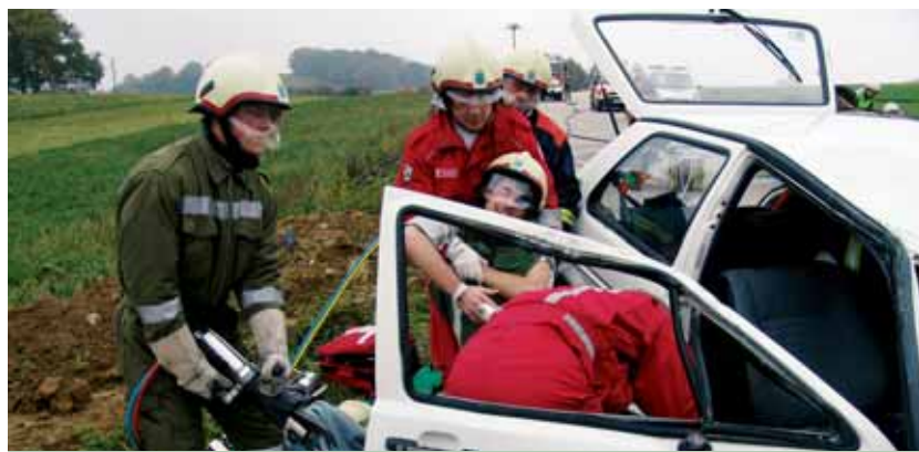
Übung der Feuerwehr Gerolding