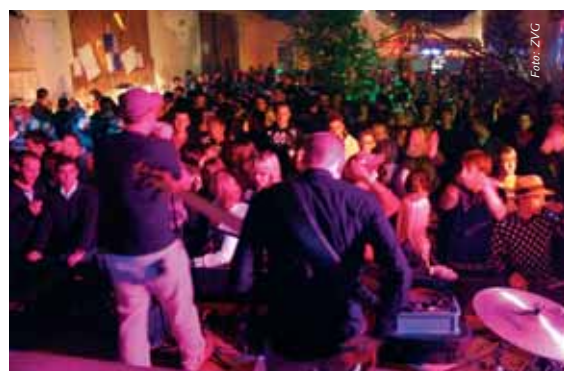
Sound Shake 2007 der MK Mauer