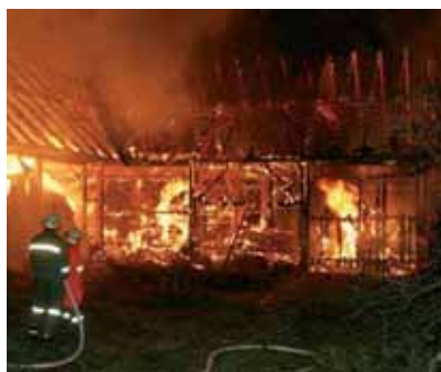
Ernstfall bei der FF-Häusling

Einsatzmäßig war 2007 ein abwechslungsreiches Jahr, wobei insgesamt 1249 Einsatzstunden geleistet wurden. Wir wurden zu fünfzehn