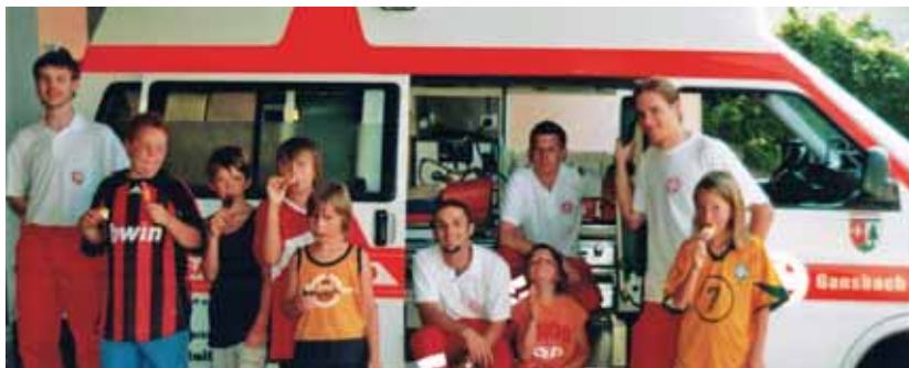
Volksschulkinder zu Besuch bei der ASBÖ-Stelle in Gansbach

Das heurige Jahr war für uns geprägt durch eine große Veränderung und vielen kleineren, aber nicht minderen Herausforderungen. Nur durch organisatorisches Geschick von unserem Dienststellenleiter und dem vollen Engagement der insgesamt 18 freiwilligen Rettungssanitätern – allen voran unser Obmann – konnten alle Krankentransporte zum Wohl der Patienten bewältigt werden.