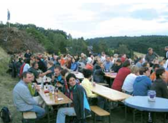
Sonnwendfeuer des DV Mauer