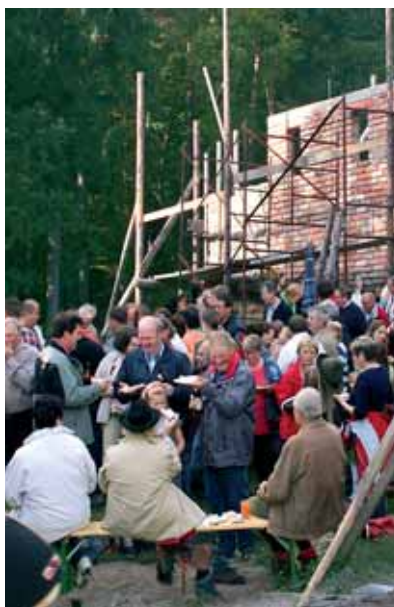
Labstelle Kalkofen beim Kochholzer Wandertag 2007

Mit dem nachfolgenden Kurzbericht möchte ich Ihnen Einblick in unsere Arbeitsfelder vom Jahr 2007 geben. Der Blumen- und Pflanzentauschmarkt fand wieder bei wunderschönem Wetter statt, freilich hätten wir uns über etwas mehr Besucher noch mehr gefreut. Unsere Frühlingswanderung zur Römerbrücke war leider ziemlich verregnet, trotzdem ließen sich 30 Personen davon nicht abschrecken und marschierten mit. Mithilfe bei der Schwimmbadinbetriebnahme, Organisation der Badeaufsicht, Pflege der Wanderwege waren weitere Tätigkeitsbereiche. Beim Kalkofen wurde intensiv gearbeitet, inzwischen haben wir auch das Dach schon drauf, und der Brennraum wurde ausgeräumt. Trotzdem wartet noch viel Arbeit. Wir haben uns das Ziel gesteckt im September 2008 die Fertigstellung mit einem ordentlichen Fest zu feiern. Eine alte Mineraliensammlung, welche am Dachboden der alten Schule vergammelte wurde neu eingeordnet und von einem Mineralogen klassifiziert. Bei der Blumenschmuckbewertung stellten wir einen Vertreter, bei der Müllsammelaktion nahm eine Abordnung teil, bei der Planung vom neuen Friedhof waren wir geladen. Mit den Jugend-